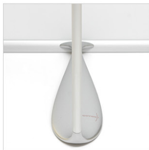
PIED ET MAT. Aluminium