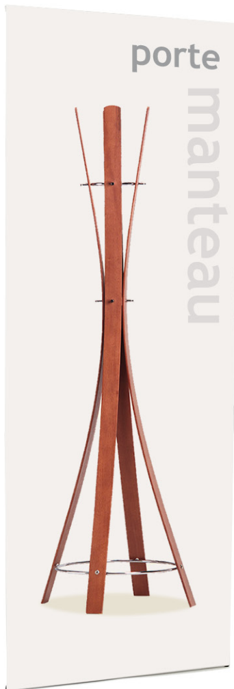
Banner S 80 x 210 cm Réf. SPE-BS01